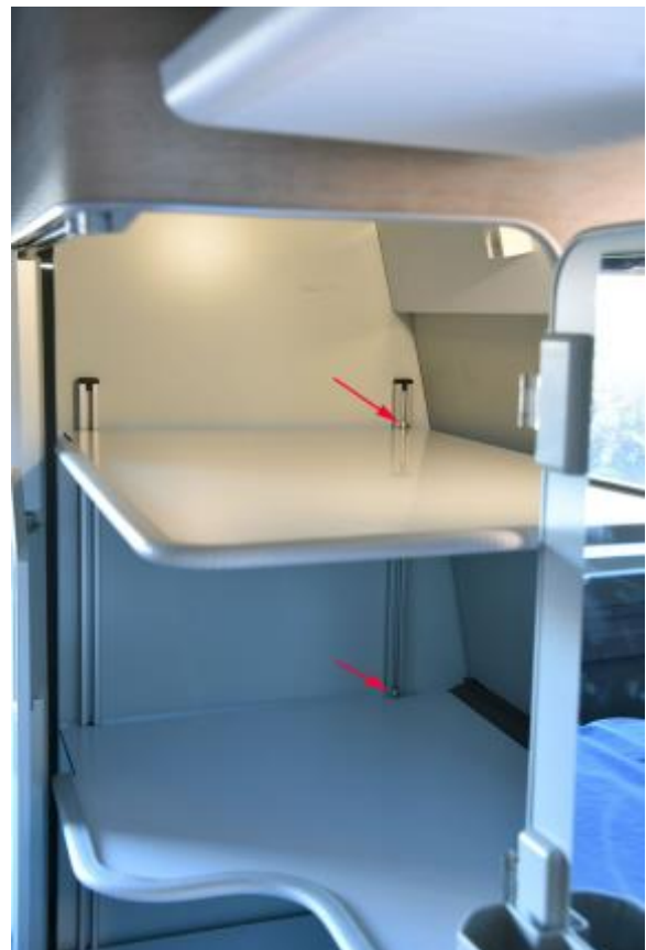
Pour finir, bloquez les étagères à l'aide des longues vis supérieures insérées- au début.

Lorsque tous les espacements sont ajustés correctement, vous pouvez retirer les films de protection des étagères et des bandes velcro pour les coller définitivement.