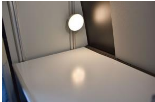
Insérez l'étage du milieu.