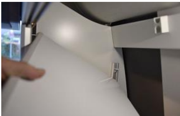
Finissez par le dernier étage.

Lorsque tous les espacements sont ajustés correctement, vous pouvez retirer les films de protection des étagères et des bandes velcro pour les coller définitivement.