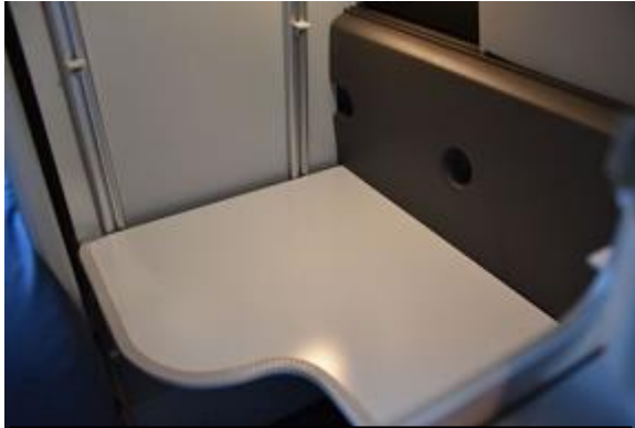
Insérez l'étage inférieur.

Ne collez pas les velcros sous les étagères sans avoir fait des tests d'ouverture et fermeture de la porte de la penderie juste en positionnant les étagères.